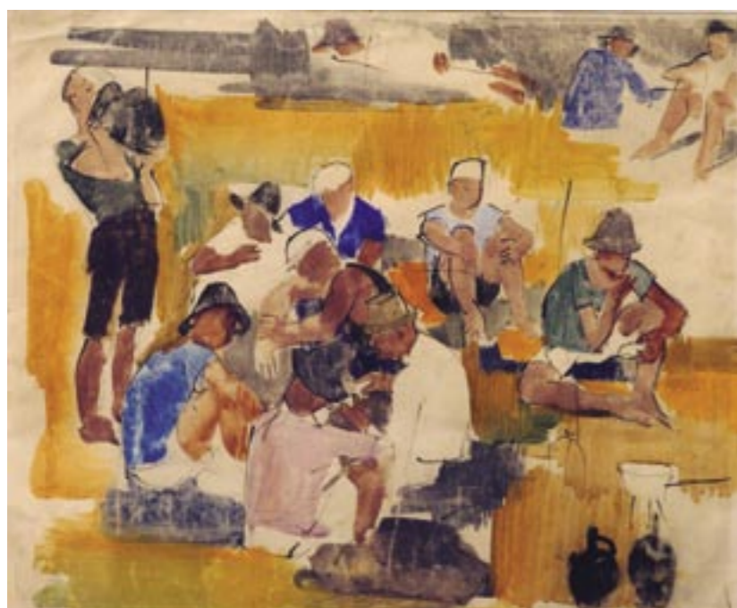
Pihenő aratók (1932) Resting Mowers

Vilmos Aba-Novák studied at the Academy of Fine Arts. He received several artistic awards in Europe, his works has been exhibited in Europe and in America: from Warsaw through London to New York in the national galleries, too.